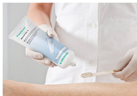
Prontosan® Gel X mer trögflytande

När såret är rengjort kan ni välja att förlänga upprensningen i såret och motverka att biofilmen tillväxer genom att applicera en av valda Prontosan® geler i såret. Applicera gelen så att den täcker sårets yta ordentligt och täck med lämpligt förband dvs ett förband som du anser passar sårets beskaffenhet. Tänk på att långvarig behandling med en fuktig gel kan öka risken för maceration av sårkanterna och dessa kan då behöva skyddas med ett barriärskydd/film.