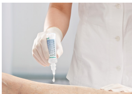
Prontosan® Sårgel mer tunnflytande

När det är dags för förbandsbyte, rengör igen, utvärdera såret och om bedömning om fortsatt behandling med Prontosan® repetera enligt guide tills ni uppnått förväntat resultat.