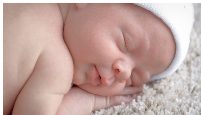
ÄVEN FÖR YNGRE PATIENTER